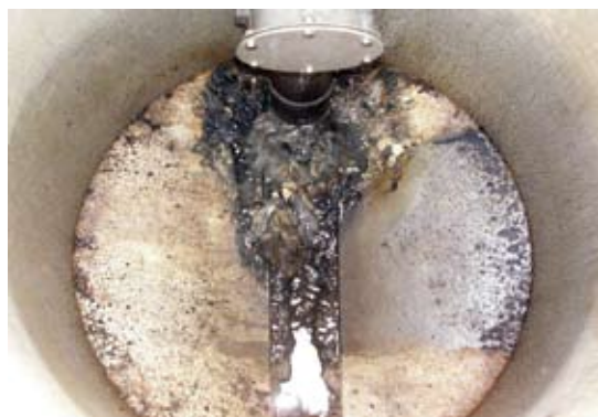
油やごみが堆積し、下水の流れが妨げられている下水道管の様子。 (上：上蓮花寺一丁目のマンホール、右：上蓮花寺一丁目の下水道管内部)