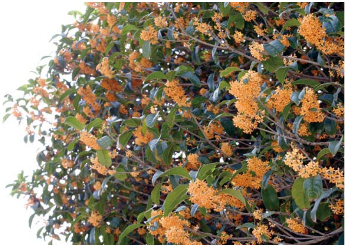
→ 10月9日、甘い香りで人を誘うキンモクセイ。