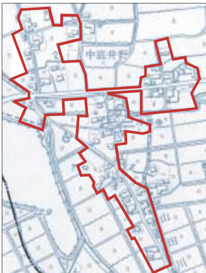
(指定区域の範囲は予定)