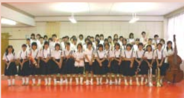
吹奏楽コンクール金賞 中間中学校吹奏楽部