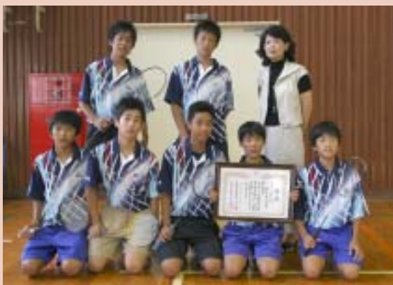
バドミントン男子団体ベスト8 中間南中学校バドミントン部