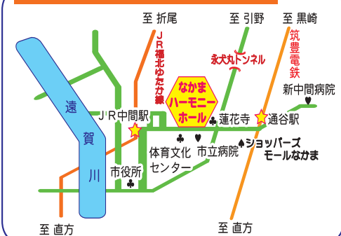
【なかまハーモニーホール案内図】

大ホールへの入場は整理券が必要（整理券の申込は締め切っています）ですが、気軽に入れるサテライト会場（入場自由）で、迫力のライブ映像も楽しめます。親子や友だち、みんなそろってレッツゴー！