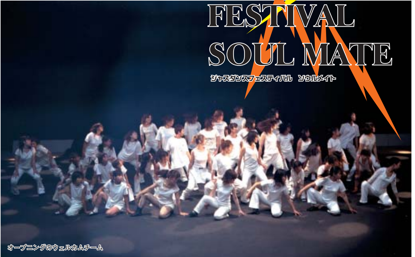
オープニングのウェルカムチーム