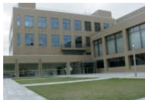
ハーモニーホールで楽しもう!