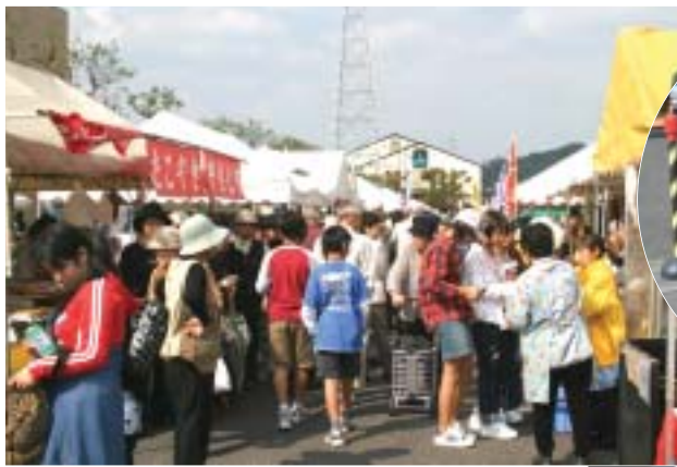
会場に並ぶ多くの出店