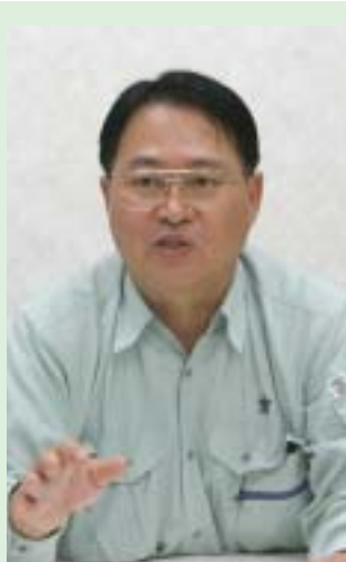
遠賀保健福祉環境事務所 衛生課副長

世は犬や猫をはじめとするペットブーム。そんなペットた ちに、飼い主はきちんと応えてあげているのでしょうか。 『私はマナーをきちんと守っているから』と言っても、そ れは思い込みで、他人からすると『非常識』に見え、ペット が悪者扱いされているかもしれません。 人々はペットによって、やすらぎを得ています。正しい飼 い方の知識を身に付け、楽しくペットと暮らしませんか。