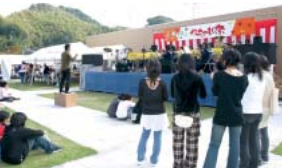
中間中学校吹奏楽部も 九州大会金賞の実力を発揮