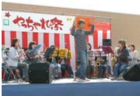
なかま市民吹奏楽団の演奏