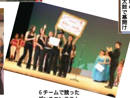
6チームで競った ダンスコンテスト