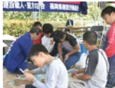
竹とんぼづくりに夢中