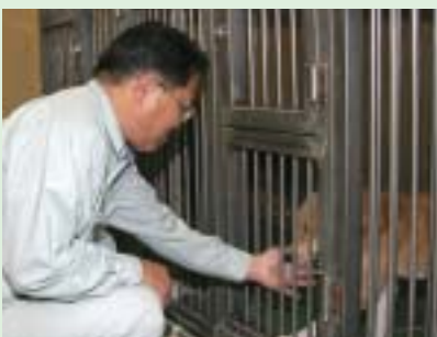
飼い主の都合で保健福祉環境事務所に持ち込まれるペットたち

現在は、日本国内では狂犬病の発生がないため、この病気に対する意識が薄れてきているようです。しかし、近隣諸国では毎年発生が報告されており、海外旅行や動物の輸入などにより、いつ何時国内に伝搬し、悲惨な状況になるかわかりません。 飼い犬の登録を行い、狂犬病予防注射を毎年受けることが、狂犬病の蔓延防止に必ず効果を発揮します。 飼いをはじめの前に十分な検討を ペットを飼える環境かどうか検討し、近隣の人間関係に配慮することが大切です。そして、一生飼えるかどうかを家族で十分に話し合ってください。特に、犬は登録や狂犬病など各種伝染病予防接種、体内や対外の寄生虫駆除などに経費がかかります。