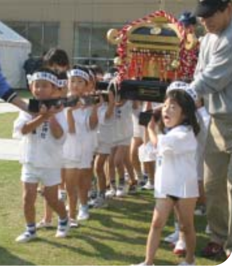
垣生幼稚園の子どもみこし