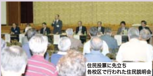
住民投票に先立ち 各校区で行われた住民説明会