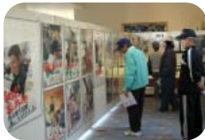
健さんの映画上映やポスター・資料展示 とともに中間出身のすごい人たちを紹介