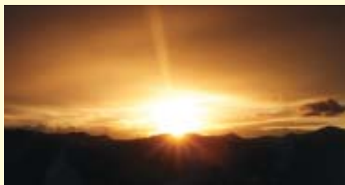
主催：中間市ふる里振興会