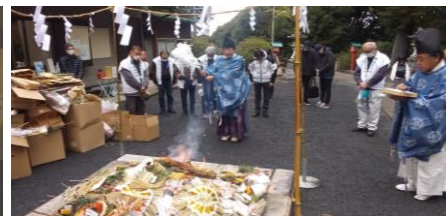
1月15日 どんどこ焼き