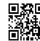
国税庁ホームページ