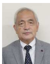
たぐち すみお 田口 澄雄 日本共産党 (日本共産党)