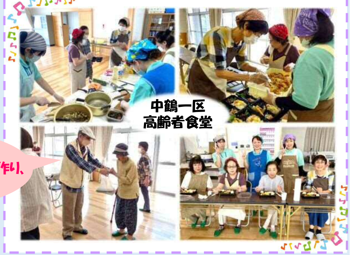
中鶴一区 高齢者食堂