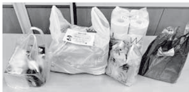
▲社会福祉協議会が実施しているフードパントリー事業での配布物(食糧品や生活用品など)

本年度から、中間市の職員に食品の寄附を募っております。今後も、社会福祉協議会や民間団体と協力しながらフードパントリー事業等を支援し、強化して参りたいと考えています。