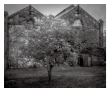
昨年の優秀賞作品

「明治日本の産業革命遺産」フォトコンテスト」では、誰もが応募できるオンラインの写真コンテストです。遠賀川水源地ポンプ室など明治日本の産業革命遺産の構成資産を魅力的に切り取った写真を募集します。応募規定など詳しくはホームページで確認してください。