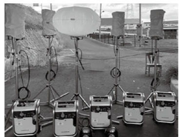
助成事業で投光器、発電機、蓄電池を新たに整備しました

一般財団法人自治総合センターでは宝くじの社会貢献広報事業として、宝くじの受託事業収入を財源とする「コミュニティ助成事業(地域防災組織育成助成事業)」を実施しています。 ●整備場所 下蓮花寺公民館、砂山公民館、鍋山公民館、本町公民館、中町公民館、垣生町公民館、中牟田公民館、太賀一區公民館、扇ヶ浦一區公民館、中鶴三区集会所 ●整備品 ○フラッシュバルーン投光器 ○発電機 ○蓄電池 この宝くじの助成金で今年度は市内10カ所の自主防災組織に備品を整備しました。これらの備品は、災害時の避難所などで活用されます。