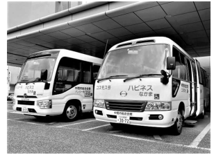
【ハピネスなかま送迎バス】