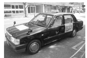
【コミュニティバスの車両】