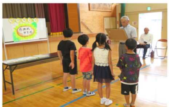
人権擁護委員より感謝状が贈呈されました。

9月22日、「人権の花」運動に協力して、ひまわりを育ててくれた中間東小学校3年生のみなさんに、人権擁護委員から感謝状と記念品が贈呈されました。