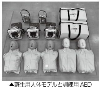
▲蘇生用人体モデルと訓練用AED

一般財団法人自治総合センターは宝くじの社会貢献広報事業として、宝くじの受託事業収入を財源とする「コミュニティ助成事業」を実施しています。