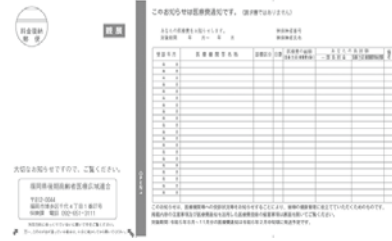
後期高齢者医療の医療費通知(見本)