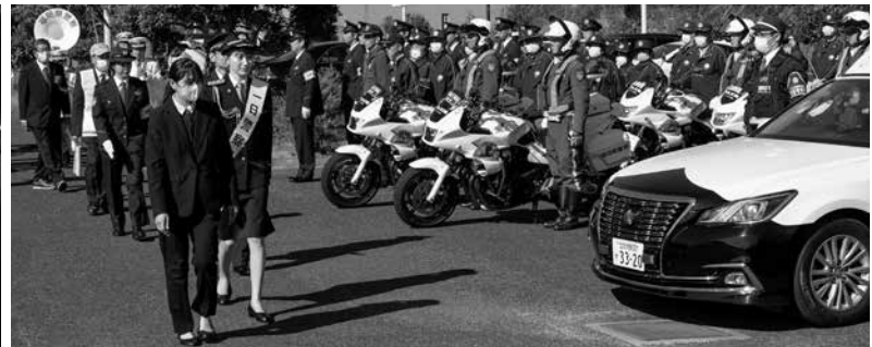
▲出発前のパトロール部隊を視察