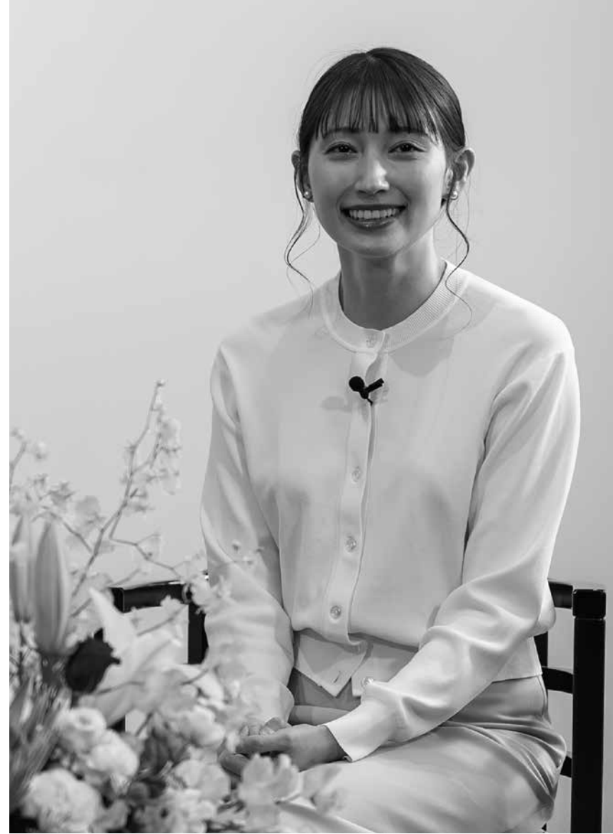
大野いと（おおのいと） 1995年7月2日生まれ。中間市出身。2016年から中間市PR大使を務める。2011年公開映画「高校デビュー」で主演デビュー。以降、映画やドラマ、CMなど幅広く活躍。主な出演作品は、映画「高津川」「ツナグ」、ドラマ「あまちゃん」、「インビジブル」、「リコカツ」など。