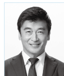
中間市長 福田 健次

※1 DX（デジタルトランスフォーメーション）…データとデジタル技術を活用して業務や組織の変革、市民サービス向上など新たな価値を創出していくこと