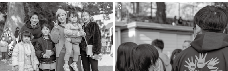
1_世界遺産「遠賀川水源地ポンプ室」で案内板を見てクイズを解く参加者 2_堀川沿いで答えがわかったのかな 3_おそろいTシャツのサミットのメンバー。当日も運営に奮闘 4_家族で参加し、見事上位入賞

中間市の小中高生が考案したイベント「トレジャーハンター『中間市の秘宝を探せ!』」が12月3日に市内で開催され、家族連れなど26組約90人が楽しみました。子どもたちの思いが詰まるこのイベント。実現までの経緯や、子どもたちの奮闘ぶりを紹介します。