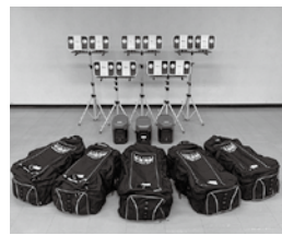
整備された投光器、蓄電池、専用エクストラバッテリー