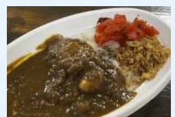
かばやんのカレー屋さん カレーライス