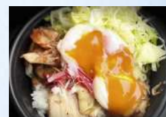
sumibi kitchen 炭火豚丼