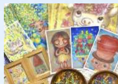
にじいろかめこ 雑貨、ステンシルバッグワークショップ