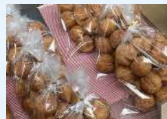
松健堂 ドライフルーツ、ナッツ、豆菓子