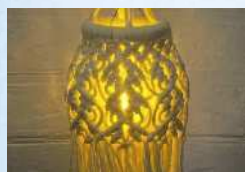
はんどめいど*てんてん マクラメ