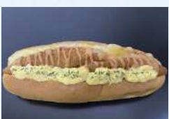
まんぷくれん ホットドッグ