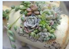
ユキハチ ガーデン雑貨、多肉植物