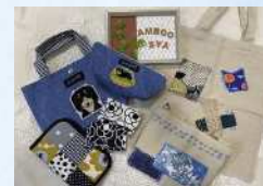
BAMBOO SYA 手作り小物、バッグ