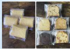
あいとはな バターケーキ、シフォンケーキ