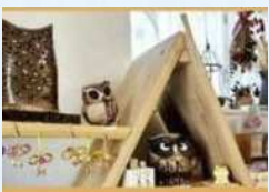
しあわせ雑貨福来郎 開運お守り、パワーストーンアクセサリ、雑貨