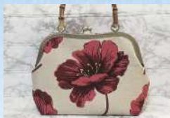
ebichann つまみ細工、ガマロバッグ