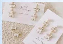
Kry ピアス、イヤリング、キーホルダー