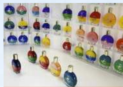
彩琳 オーラライトカラーセラピー