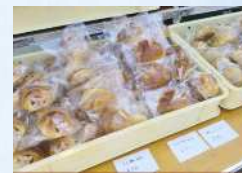
パン工房笹山 調理パン、菓子パン