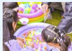
プレイフル ヨーヨー釣り、千本くじ