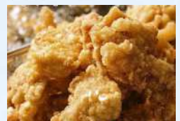
からあげにわ菓 からあげ