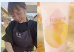
サロンドフルベール 首肩マッサージ