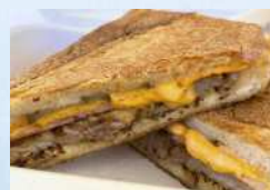
Carlos☆Cubano クバーノ(キューバ生まれのホットサンド)、トロピカルジュース