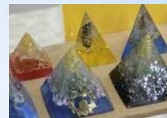
Kulala タロットカード、霊視鑑定