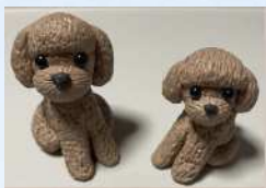
ちょころん レジンアクセサリ、樹脂粘土