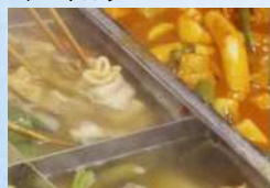
韓国屋台 ひら田 韓国おでん、トッポギ、ホットク