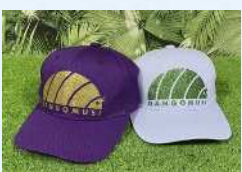
だんご屋 ダンゴムシグッズ