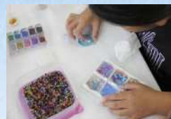
ジャスミン レジンワークショップ