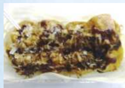
芽衣 関門海峡ダコのたこ焼き