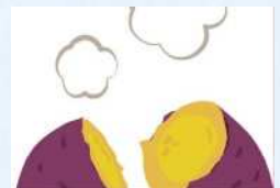
焼き芋ゆいちゃん 焼きも