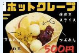
馬九 芋あんホットクレープ