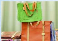
ツリーランチ 知育玩具、はしっこバッグ