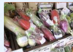
みきふあーむ 野菜、新米、味噌、漬物等