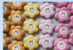
lislis アイシングクッキー、サブレ