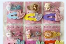
Nicoribbon キッズアクセサリ、ワークショップ