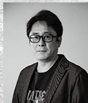
七尾 与史 1969年生まれ、静岡県浜松市出身。2009年『このミステリーがすごい!』大賞に応募した『死亡フラグが立ちました!』が最終選考に残り、2010年に同作で作家デビュー。ほかに『DS刑事』シリーズ(日本テレビ系TVドラマ化)、『偶然屋』など著書多数。